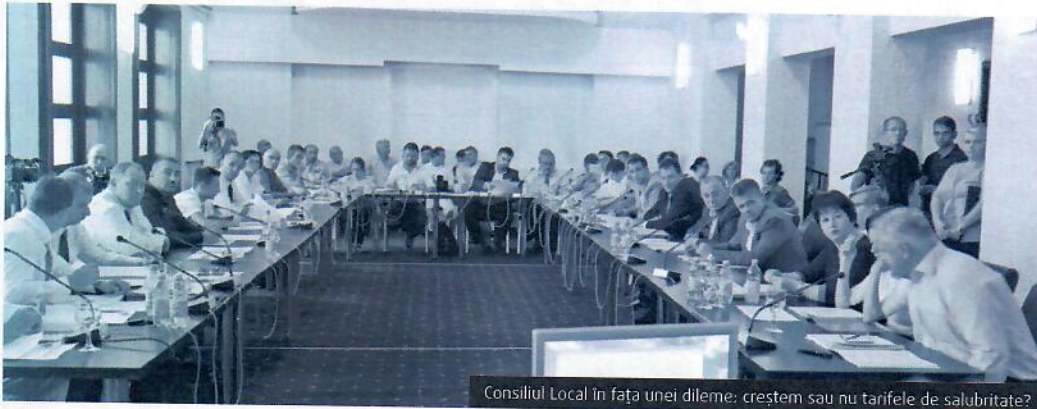
Consiliul Local în fața unei dileme: creștem sau nu tarifele de salubritate?