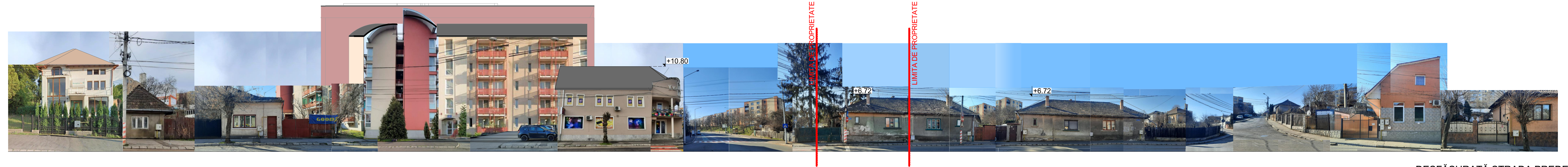
DESFĂȘURATĂ STRADA PREDEAL