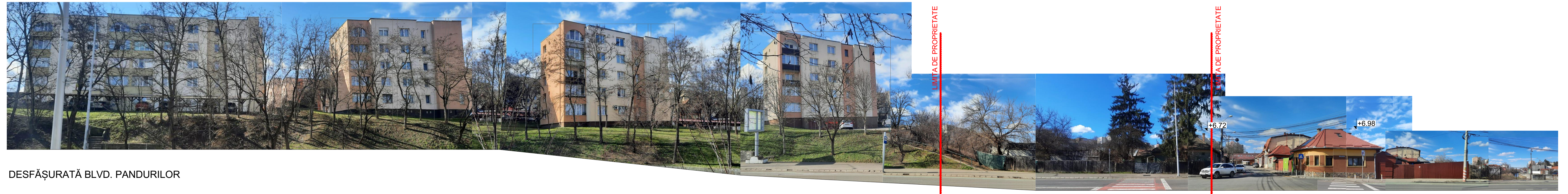
DESFĂȘURATĂ BLVD. PANDURILOR