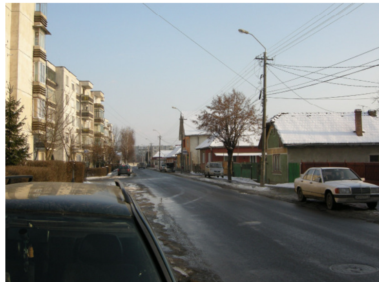
PERSPECTIVA STR. BARAGANULUI