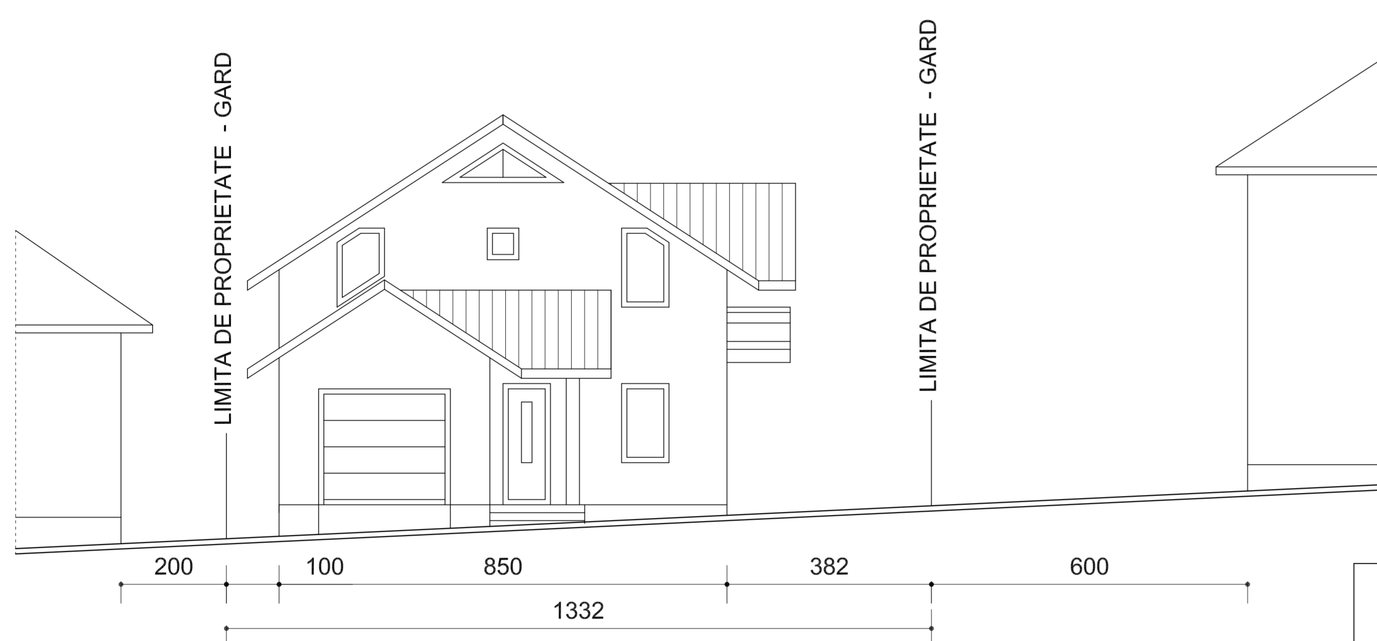
SECTIUNE TRANSVERSALA sc. 1: 200