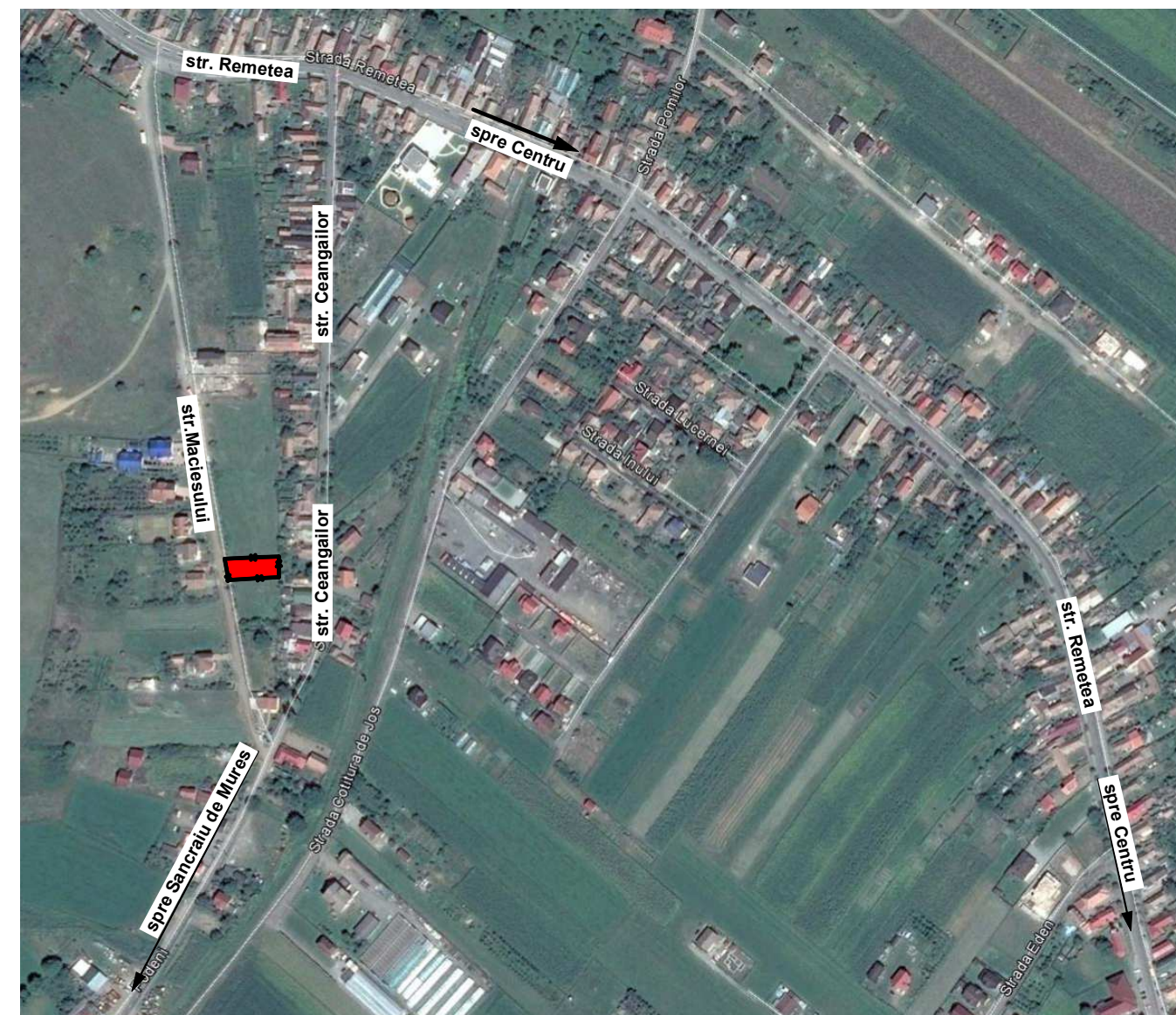
PLAN DE INCADRARE GOOGLE EARTH 2016 MAI