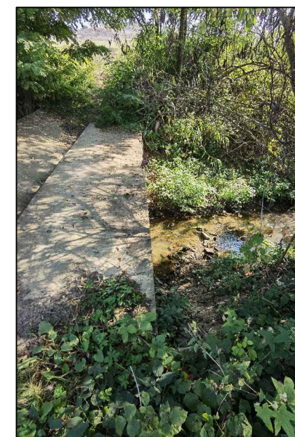
PODET EXISTENT peste parau VOINICENI

L2cz SUBZONA subzona locuintelor individuale si colective mici cu P+1,2 niveluri retrase de la aliniament cu regim de cosntruire discontinuu/continuu sau grupat, situat in noile extinderi