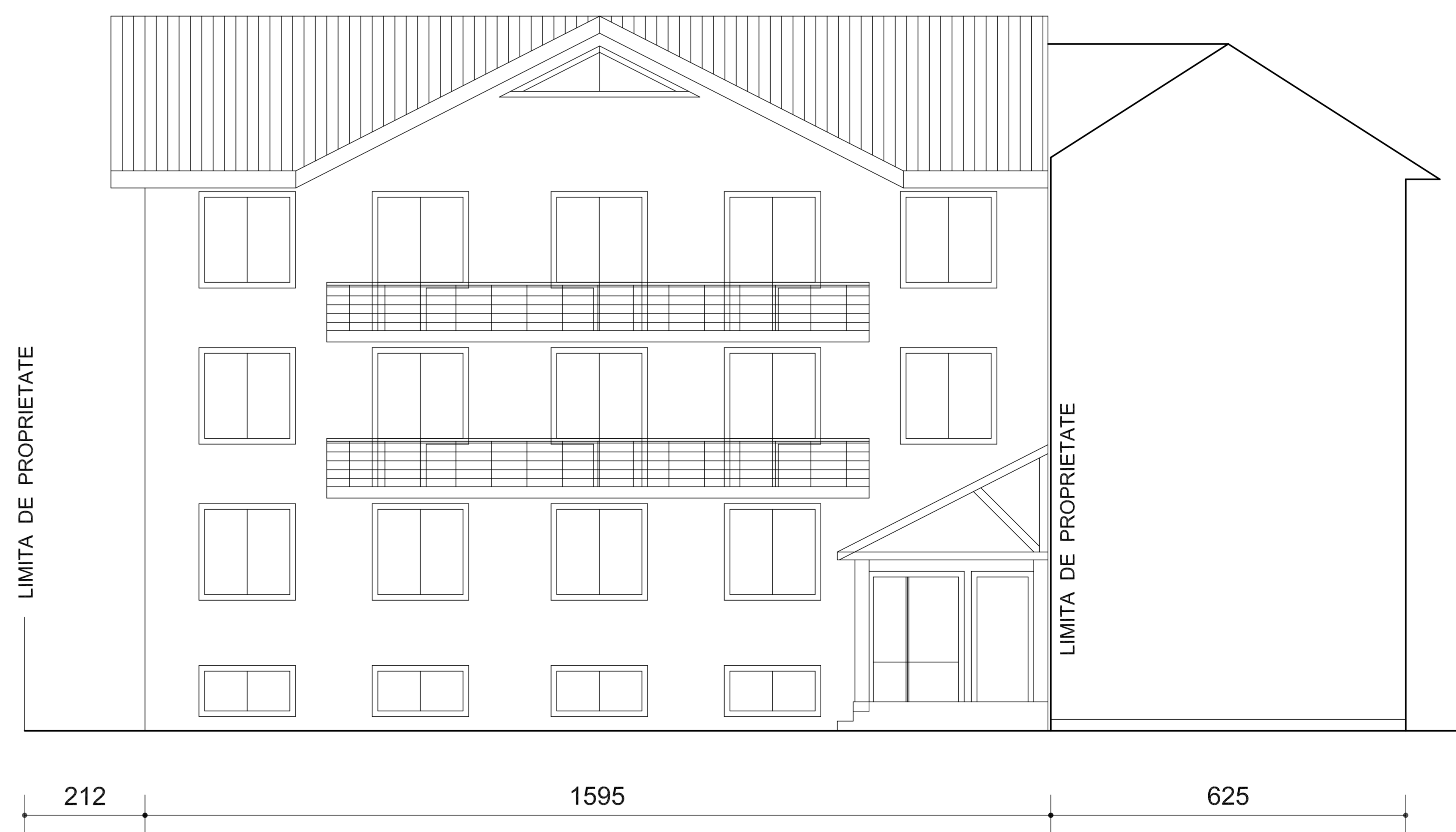
SECTIUNE TRANSVERSALA sc. 1: 200