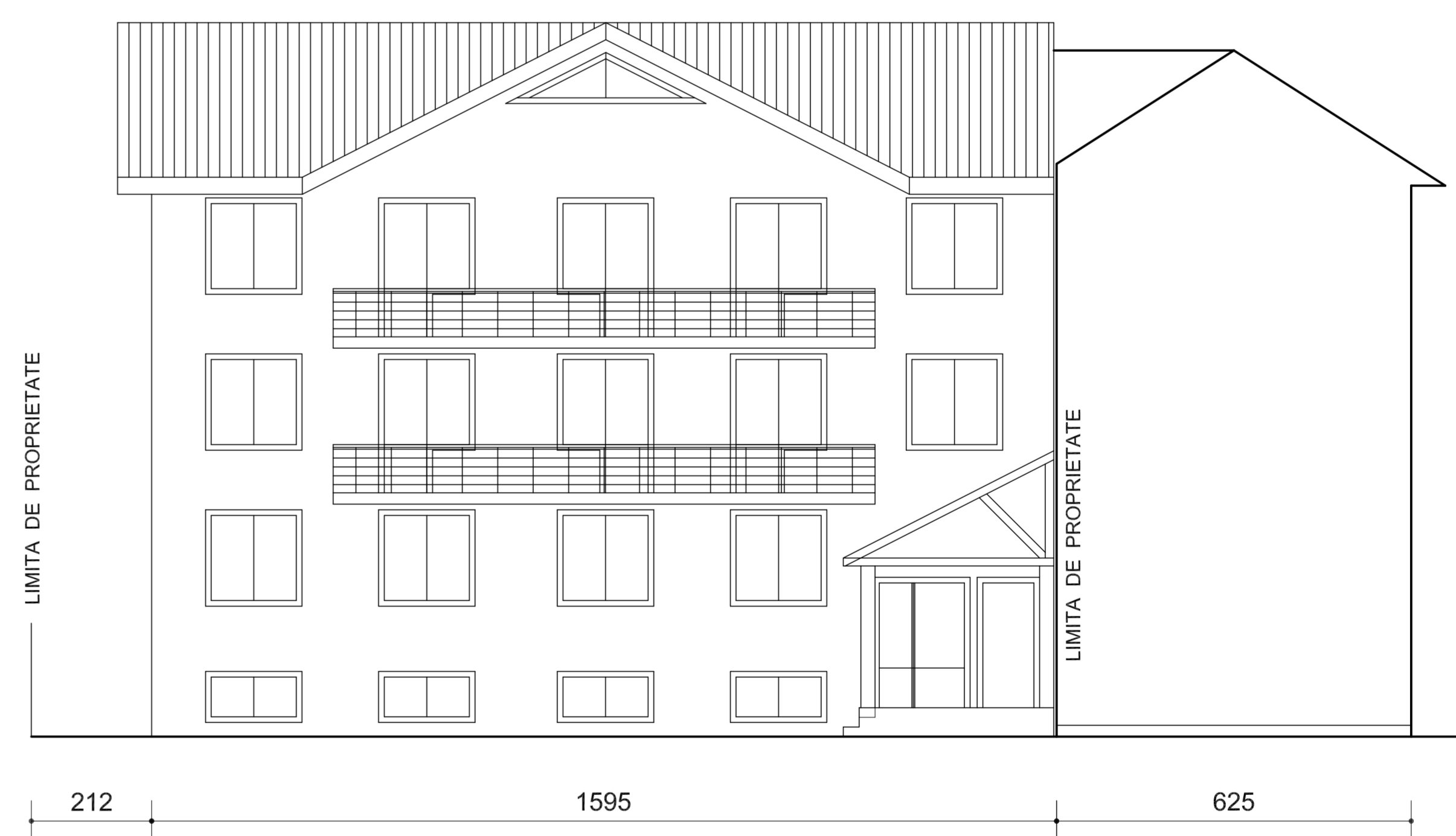
SECTIUNE TRANSVERSALA sc. 1: 200