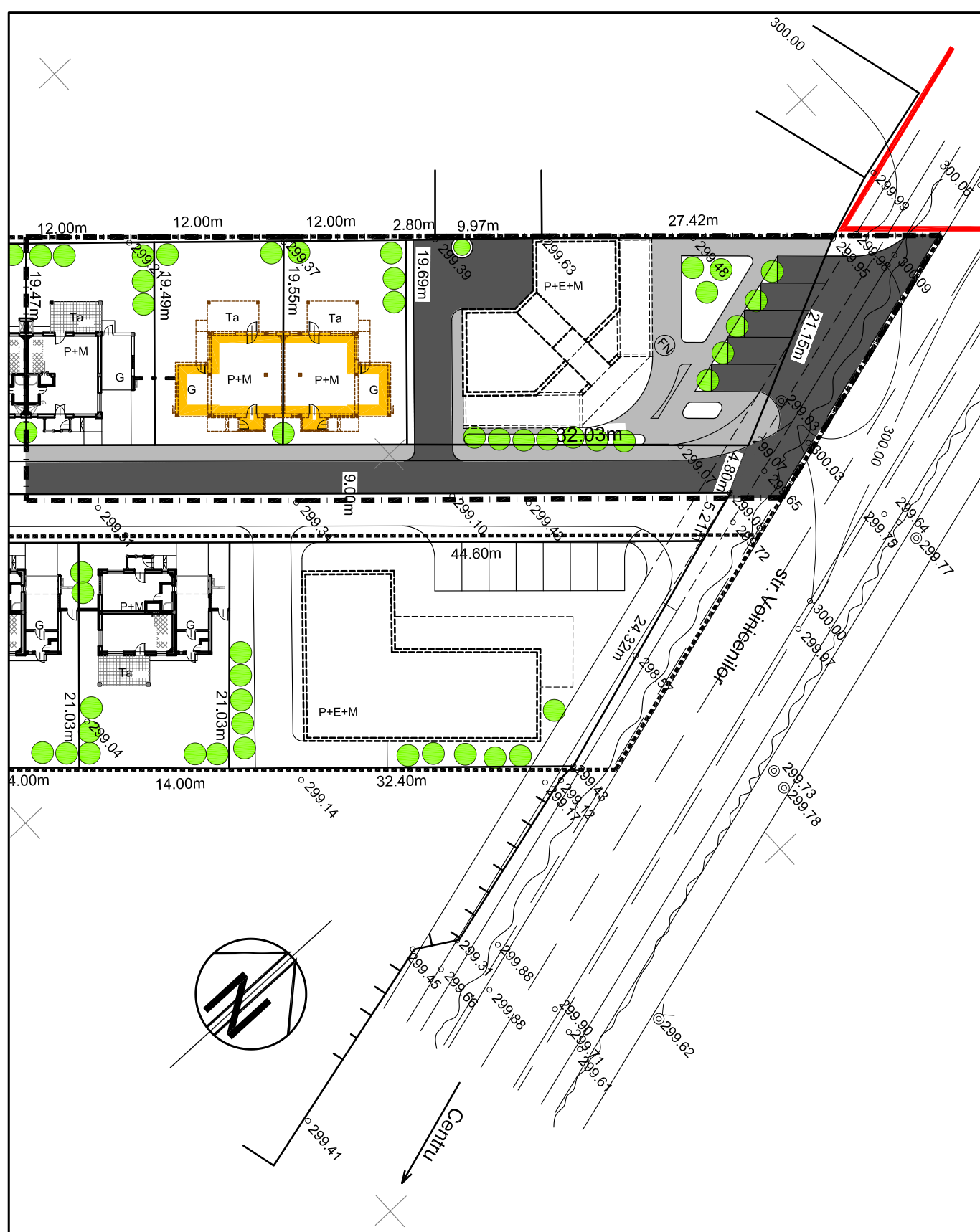
BILANT TERITORIAL-conform PUD 683/2004