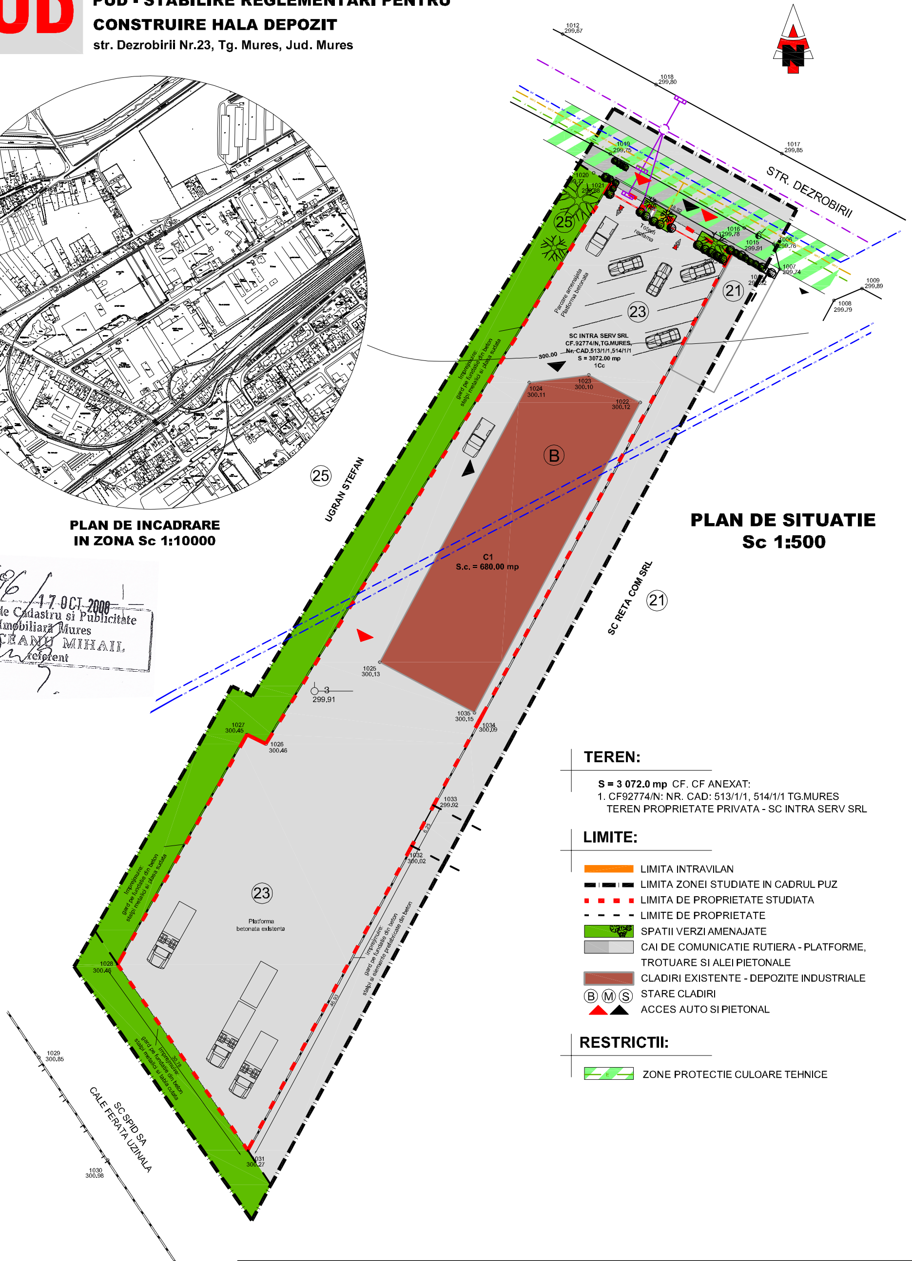
PLAN DE SITUATIE Sc 1:500

4696 / 17 OCT 2008 Oficiul de Cadastru si Publicitate Imobiliara Mures RACEANU MIHAIL referent