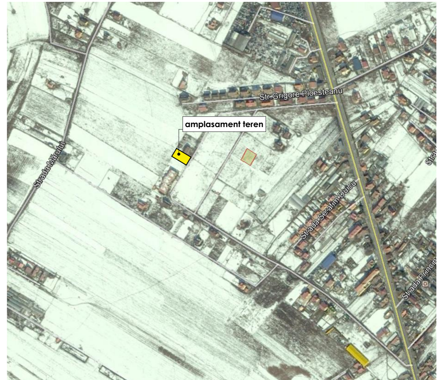
0. PLAN DE INCADRARE 1:5000