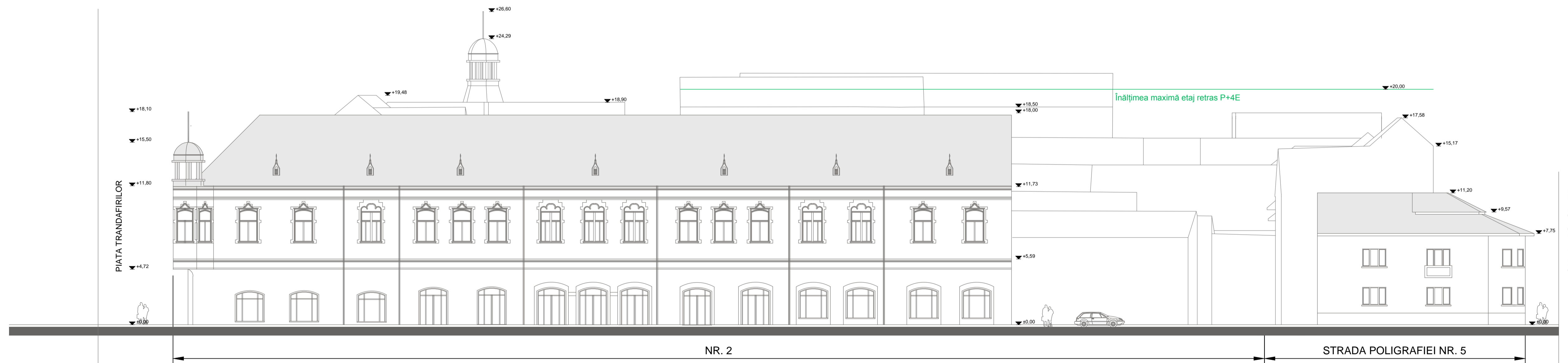
DESFASURATA STRADALA - STRADA BARTOK BELA