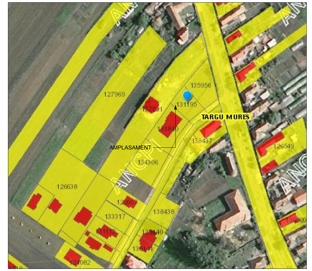
EXTRAS PLAN ETERRA PENTRU ZONA STUDIATA