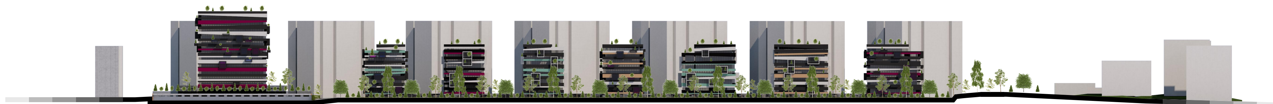
DESFASURATA strada propusa paralela cu strad LIVEZENI scara 1:1000