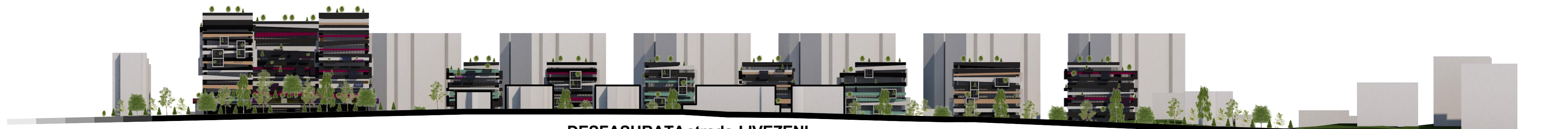
DESFASURATA strada LIVEZENI scara 1:1000