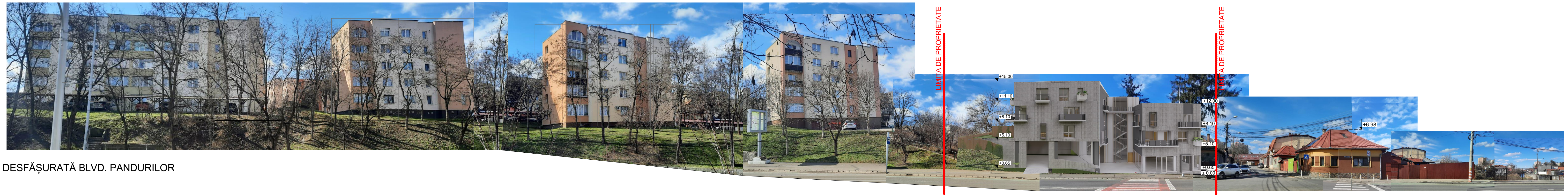
DESFĂȘURATĂ BLVD. PANDURILOR