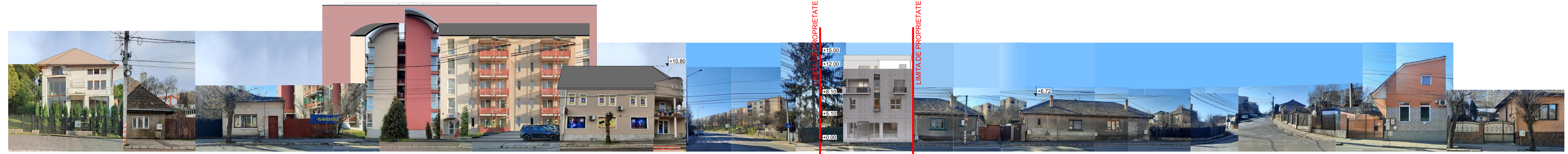
DESFĂȘURATĂ STRADA PREDEAL